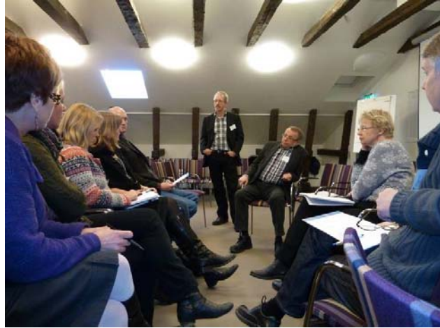
Diskussion med några av deltagarna vid den första utbildningsträffen i Vänersborg 9 februari 2011.

Länsstyrelsen i Västerbotten, Västra Götalandsregionen, Region Skåne och Dalarna deltar i ett projekt som drivs av Tillväxtverket och som handlar om utbildning om innovativ upphandling. Projektet har påbörjats i Västra Götaland och under våren 2011 kommer förankrings-/planeringsarbetet påbörjas för de insatser som ska genomföras i Skåne under våren och i Västerbotten under hösten 2011. Projektet syftar först och främst till att öka kunskapen om offentlig upphandling hos offentliga tjänstemän, politiker samt mindre producenter/leverantörer av främst livsmedel. Men det handlar även om att vidareutveckla och sprida en utbildningsmodell som bedrivits i Dalarna under det tidigare Kommersiella utvecklingsprogrammet för Dalarna 2004 – 2007.