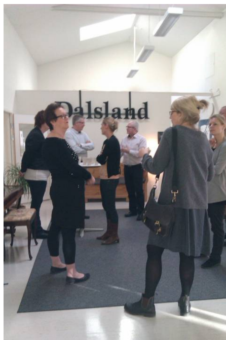
Västerbottens länsövergripande serviceprojekt på besök i Dalsland tillsammans med Västra Götalandsregionen.

Tillväxtverket har sedan förra uppföljningsrapporten arrangerat ett seminarium för regionala kontaktpersoner på serviceområdet. Det