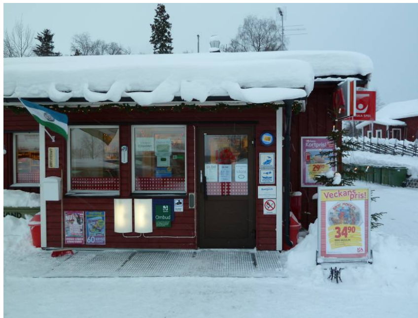
Dagligvarubutik som ombud för flera serviceslag. Ica-Nära i Kall (Jämtland)

Dagligvaror har sedan tidigare haft en central roll i diskussionen kring tillgänglighet till service. Med ett minskat befolkningsunderlag blir det allt svårare att upprätthålla landsbygdsbutiker. Ändrade inköpsmönster hos befolkningen och skärpta grossist- och leveransvillkor är de största hoten. Hotet från lågpriskedjor och stormarknader blir allt större och finns över hela landet. Utmaningen är att försöka tillföra fler serviceslag till de mindre dagligvarubutikerna. Drivmedelspump, utlämning av apoteks- och systembolagsvaror, post, turisminformation och betaltjänster är några exempel som kan ge besökaren fler anledningar att besöka butiken. Därmed ökar samtidigt möjligheten till ökad försäljning av dagligvaror. Nedan beskrivs med länens egna ord hur man bedömer utvecklingen av tillgänglighet till dagligvaror det senaste året.