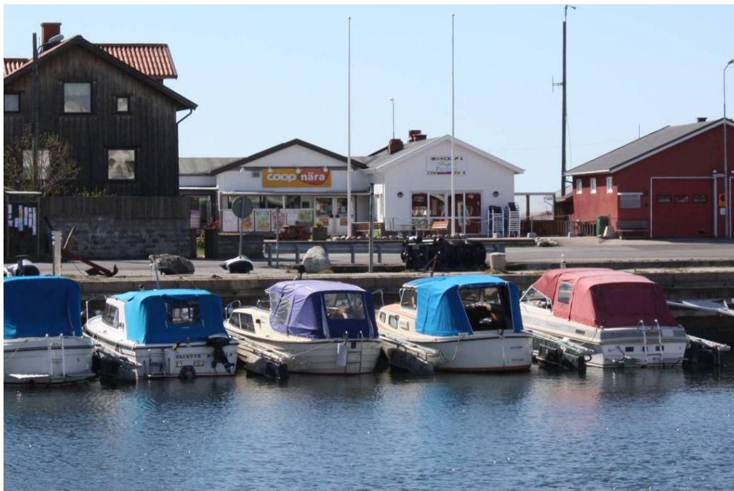
Dagligvarubutik i skärgården är viktigt för både boende och besökare i skärgården. Källö-Knippla (Västra Götaland)

Utvecklingen av tillgängligheten till drivmedel och dagligvaror är viktig för både invånare och företag i gles- och landsbygder. Dessa serviceslag utgör viktiga delar för en orsts attraktivitet. En försämrad tillgänglighet minskar möjligheten för att behålla befolkning såväl som företag. Utvecklingen av besöksnäringen ställer också nya krav på att det finns en god tillgänglighet av service. Den ökande tillströmningen av utländska besökare förväntar sig ofta en affär och bensinstation i varje mindre ort. Om dessa saknas så försämras förutsättningarna för destinationerna att locka besökare och de kommer få svårare att konkurrera med orter i andra regioner.