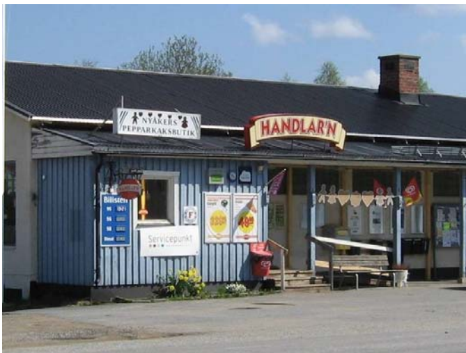
Servicepunkt i Nyåker (Nordmalings kommun).

Att utveckla eller ta fram kommunala servicestrategier är ett område som har tydlig koppling till samverkanslösningar mellan kommersiell och offentlig service. I 10 av länens serviceprogram finns prioriterade insatser/aktiviteter inom området vilket inrymmer verksamhet med koppling mot tre olika nivåer av kommunala planeringsdokument: översiktsplan, varuförsörjningsplan och serviceplan.